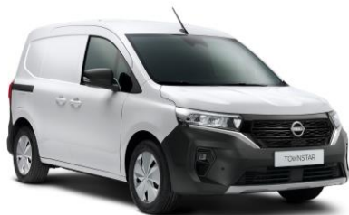
Bílá QNG – 0 Kč