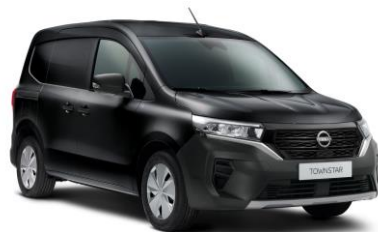
Černá GNE – 15.000 Kč