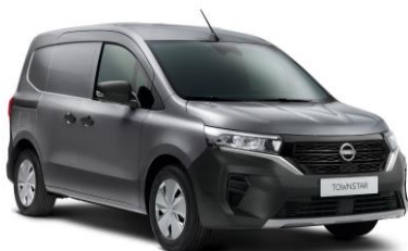
Šedá Casiopee KNG – 15.000 Kč