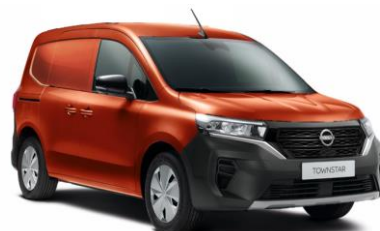
Terakota CNZ – 15.000 Kč