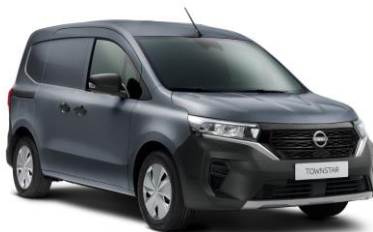
Šedá KPW – 7.000 Kč