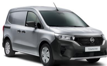
Šedá perleť KQA – 15.000 Kč